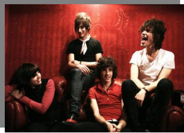
THE DODOZ Le 12 Novembre Sur l'axe Toulouse⇌Paris