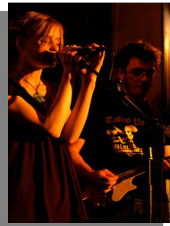
RUM TUM TIDDLE Les 12 et 13 Novembre Sur l'axe Nantes⇌Paris