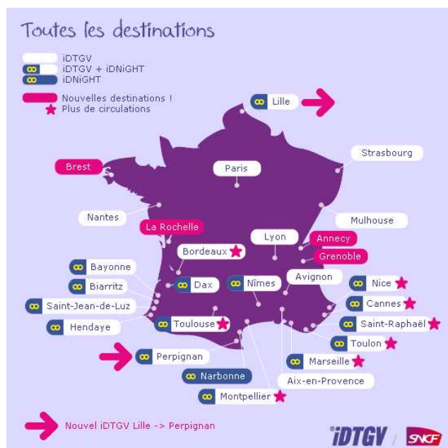
Ci-dessus : à terme, les destinations iDTGV dans toute la France

Egalement au programme des ouvertures : un train Province-Province supplémentaire sur l'axe Lille↔Montpellier, après le lancement du Lille↔Nice début juillet 2009.